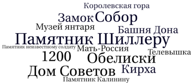
Рис. 3. Историко-культурные объекты и архитектурные сооружения Калининграда

Неотъемлемую часть пространства составляют объекты историко-культурного наследия (рис. 3), благодаря которым в исторической памяти формируются определенные устойчивые представления о прошлом земли, где они расположены. С другой стороны, размещение своих памятников на бывшей чужой земле, в чуждом культурном ландшафте позволяет конструировать собственную историческую идентичность.